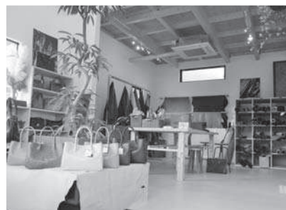
⑤店内には革や革製品がずらり

クラフト体験教室では店内の革素材の中から、お客様好みのものを選んで制作いただけます。名刺入れやポーチ、トートバッグ、その他様々なものが製作可能で、老若男女問わず楽しんでくださっています。ご家族や友人との参加ももちろん、お一人での体験も歓迎いたしますので「じゃらん」やHPなどから気軽にご予約下さい。二階フロアではフロアいっぱいレザーバッグを展示販売しています。