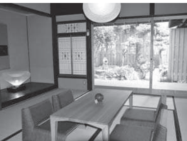
ホテルの一室の和室。中庭からは光が入り、ほっと一息つける空間です。

方法で、龍野城下町の魅力として発信したいという思いが募りました。 実現に向けて商工会議所の創業塾で経営について学び、ビジョンを固めた上で昨年の七月にkurasu masuを設立。龍野の暮らしに出会える宿”をコンセプトとする古民家ホテル「kurasu」の運営やデザイン知識を活かした商品企画などを行っています。