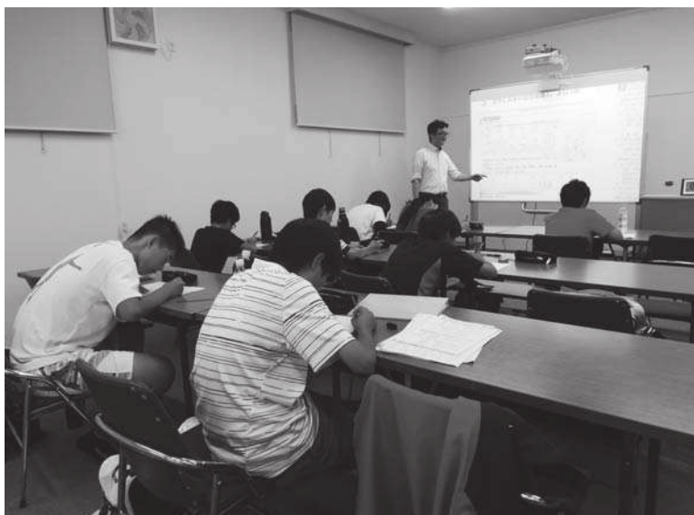
電子黒板を使用した授業風景